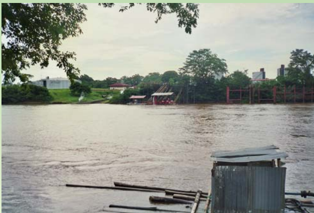
Anlage mitten im Regenwald

Immer neue Konzessionen werden von den Regierungen ausgewiesen und die sog. Blöcke transnationalen Ölonternehmen zur Ausbeutung überlassen.